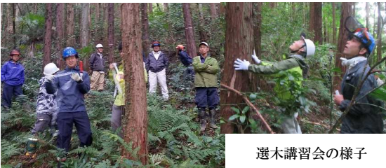
選木講習会の様子