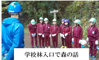
学校林入口で森の話

6年生は、卒業記念植樹、5年生は間伐体験、クリスマス前には、間伐した材を学校に持ち帰り、クリスマスリースづくりなどの木工制作指導を行っています。北都留森林組合では、子供たちが森に関心をもち、理解し、行動を起こすきっかけとなる活動を提案し、これからも、森と共に生きる「ことの大切さや素晴らしさを地元の子供たちに伝えていくことが森林組合の使命と考えて引き続き活動を継続していきます。