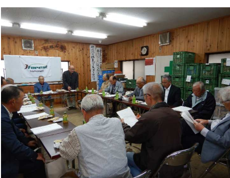
平成29年10月4日 第2回北都留森林組合理事会開催 (本所会議室)

北都留森林組合理事定数削減承認 現行定数20名から12名へは、平成29年7月に全10地区総代様にお集まり頂き開催した地区運営協議会でも承認頂き、平成29年10月4日開催された理事会でも承認頂きました。今年5月に開催された総代会に置かれて正式ご承認頂くことで来年度に予定されている理事選挙から変更となります。これまでご説明してきました通り、より良い森林組合経営を実現していく上でスピード感のあるフットワークの軽い、機動力のある理事会運営を実現するための一歩となります。組合員の皆様におかれましては、ぜひ森林組合経営改革推進のためにご理解とご協力をお願い申し上げます。