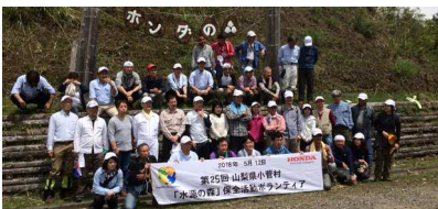
ホンダの森小菅集合写真