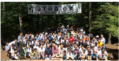
JTの森小菅集合写真

平成30年5月12日にホンダの森小菅、6月30日にJTの森小菅と大勢の社員や村民参加のもと森林整備活動が盛大に開催されました。