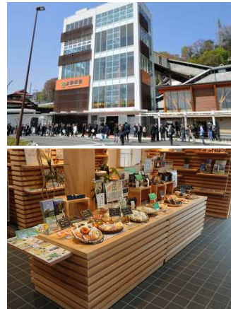
JR 上野原駅前周辺の木材活用

JOLA2018 HP http://jola-award.jp/winner/1160/