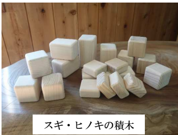
スギ・ヒノキの積木