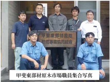
甲斐東部材原木市場職員集合写真

甲斐東部材原木市場 甲斐東部産地形成事業協同組合）は山梨県東部の木材拠点施設として大月市初狩町に平成5年に設立され、北都留森林組合、南都留森林組合、大月市森林組合の3森林組合が中心となり経営している郡内唯一の原木市場です。 原木市場は、森と街を繋ぐ「森の港」のような中継基地としての役割を持っており、様々な丸太と情報が集まる大切な施設です。このたび、新しい職員2名を迎え、新たな一歩を踏み出しました。 山梨県内にある他の2拠点、由梨県森林組合連合会原木市場、南部町森林組合原木市場と更なる連携強化を進め、大都市の東京都と神奈川県と隣接する原木市場として丸太販売を積極的に展開し、三方よし（由主・顧客・地域）の経営を目指します。 相模川と多摩川という二つの流域を繋ぐことで東京都と神奈川県と繋がる新たな木材ビジネスを展開していきます、流域林業活性化センター、森の総合商社の役割を使命と考えて原木市場経営を継続していきます。