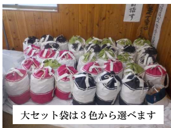
大セット袋は3色から選べます